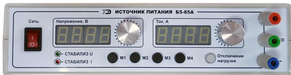
Рисунок 1 – Лицевая панель источника питания

Заводской номер, обеспечивающий однозначную идентификацию каждого экземпляра источника питания, наносится на маркировочную наклейку на задней панели источника питания типографским методом в виде цифрового кода, состоящего из десяти арабских цифр.