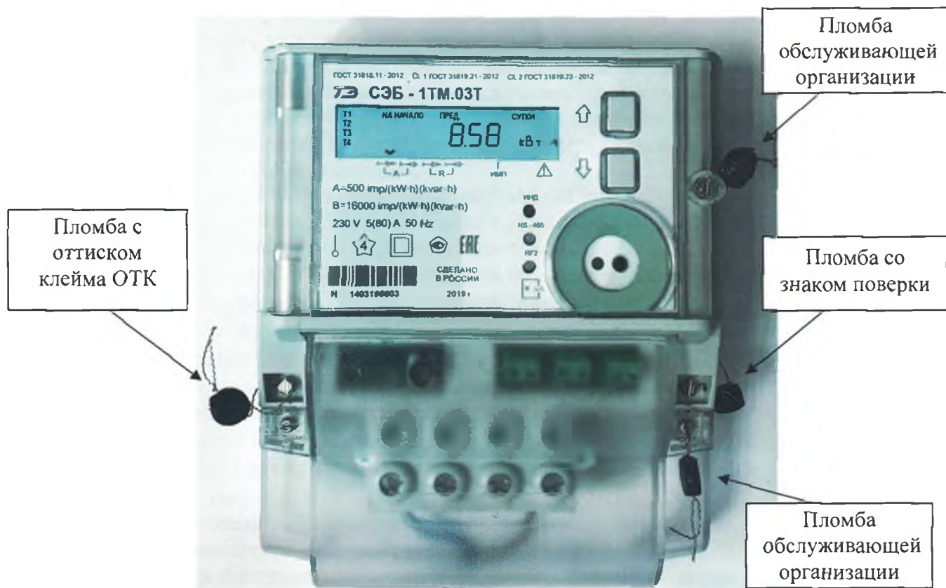
Рисунок 1 – Общий вид счетчика внутренней установки, схема пломбировки от несанкционированного доступа, обозначение места нанесения знака поверки

На рисунке 2 приведен внешний вид удаленного терминала, который может входить в состав комплекта поставки счетчиков наружной установки.