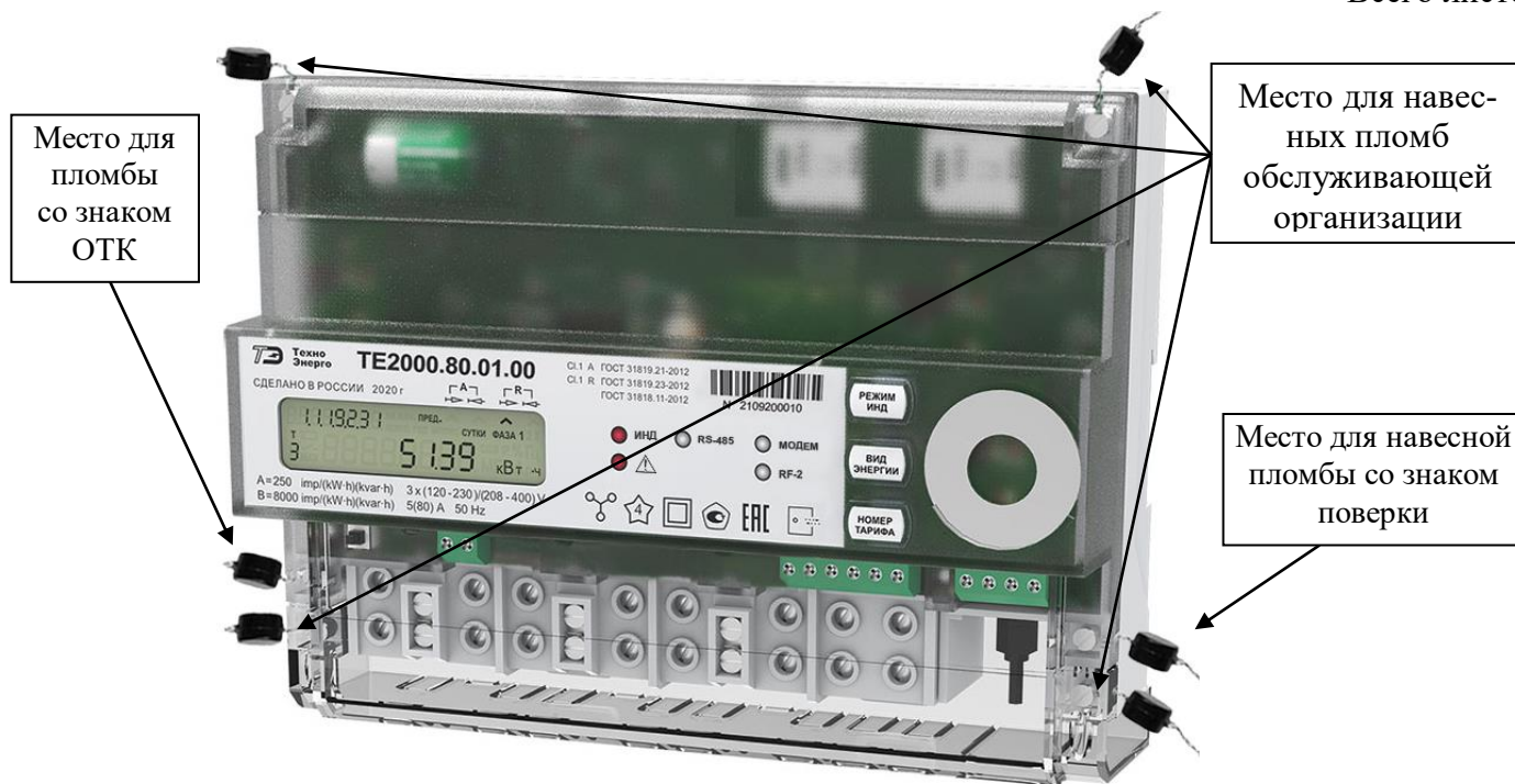
Рисунок 3 – Общий вид счетчика для установки на DIN-рейку, схема пломбировки от несанкционированного доступа, обозначение места нанесения знака поверки