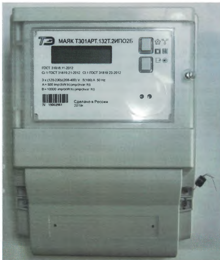
Рисунок 1 – Общий вид счетчика электрической энергии трехфазного статического МАЯК Т301АРТ